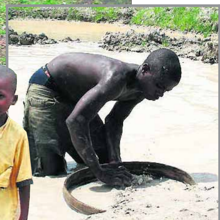
■ Vroeger de hele dag aan het werk; nu krijgen de kinderen dankzij de Sunday Foundation onderdak en onderwijs.