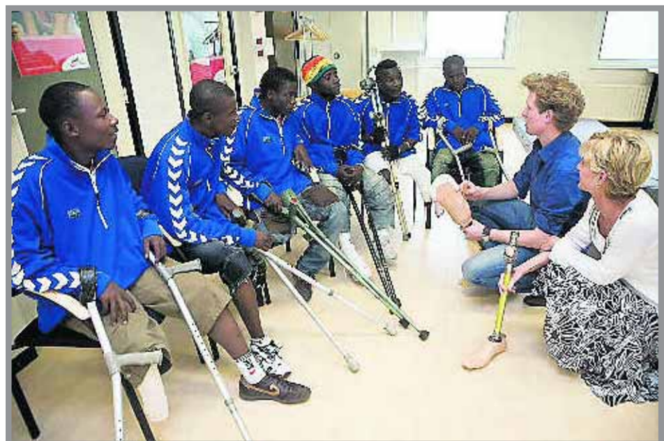
■ Bij Livit, gespecialiseerd in orthopedische hulpmiddelen, krijgen de 'amputatievoetballers' uit Sierra Leone protheses.

Bestsellerschrijver redde in Sierra Leone kindslaven uit diamantmijn